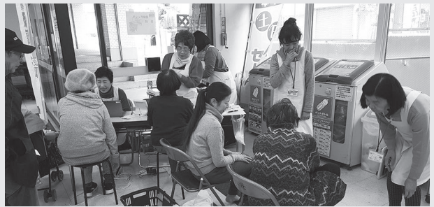
神奈川県民センター