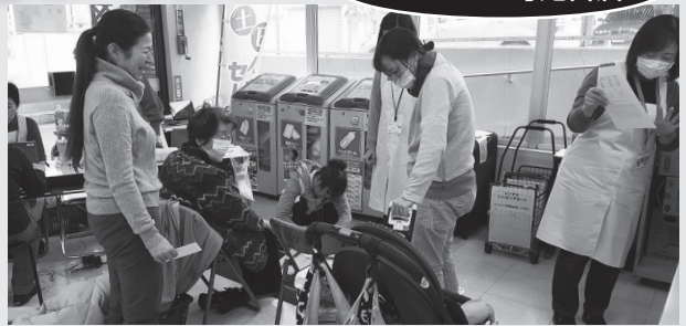
ユーコープ寺尾台店