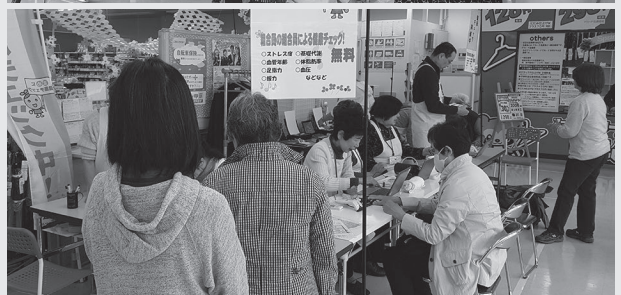
健康づくりリーダー養成講座